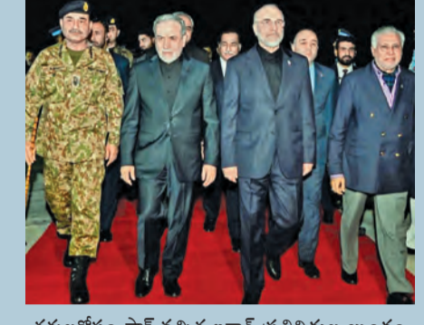
చర్యలకోసం పాక్ వచ్చిన ఇరాన్ ప్రతినిధుల బృందం

ఇస్లామాబాద్లో 'అమెరికా, ఇరాన్ మధ్య తొలిరోజు నాలుగు గంటలు చర్చలు పాక్ ప్రధాని షేహబాజ్ షరీఫ్ మధ్యవర్తిత్వం స్తంభించిన ఆస్తులు, నిధులు విడుదల చేయాలని ఇరాన్ డిమాండ్ కొత్త షరతులతో ముందుకు సాగని చర్చలు హార్డుకోపై కొనసాగుతున్న ప్రతిష్టంభన