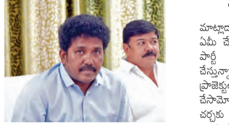
అనంతపురం, ఏప్రిల్ 11, ప్రభాతవార్త బ్యారీ