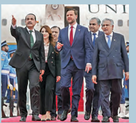
శనివారం ఇస్లామాబాద్ చేరుకున్న జెడిఎస్ బృందం ఇస్లామాబాద్, ఏప్రిల్ 11: ఇరాన్ సైన్యం ముగింపు కోసం అమెరికా, ఇరాన్ దేశాలమధ్య జరుగుతున్న శాంతి చర్చల్లో పురోగతి కనిపించకపోయినా ఒకరి డిమాండ్ వార్డర్ మరోకరు పంచుకున్నారు. >>2

ఇస్లామాబాద్లో 'అమెరికా, ఇరాన్ మధ్య తొలిరోజు నాలుగు గంటలు చర్చలు పాక్ ప్రధాని షేహబాజ్ షరీఫ్ మధ్యవర్తిత్వం స్తంభించిన ఆస్తులు, నిధులు విడుదల చేయాలని ఇరాన్ డిమాండ్ కొత్త షరతులతో ముందుకు సాగని చర్చలు హార్డుకోపై కొనసాగుతున్న ప్రతిష్టంభన