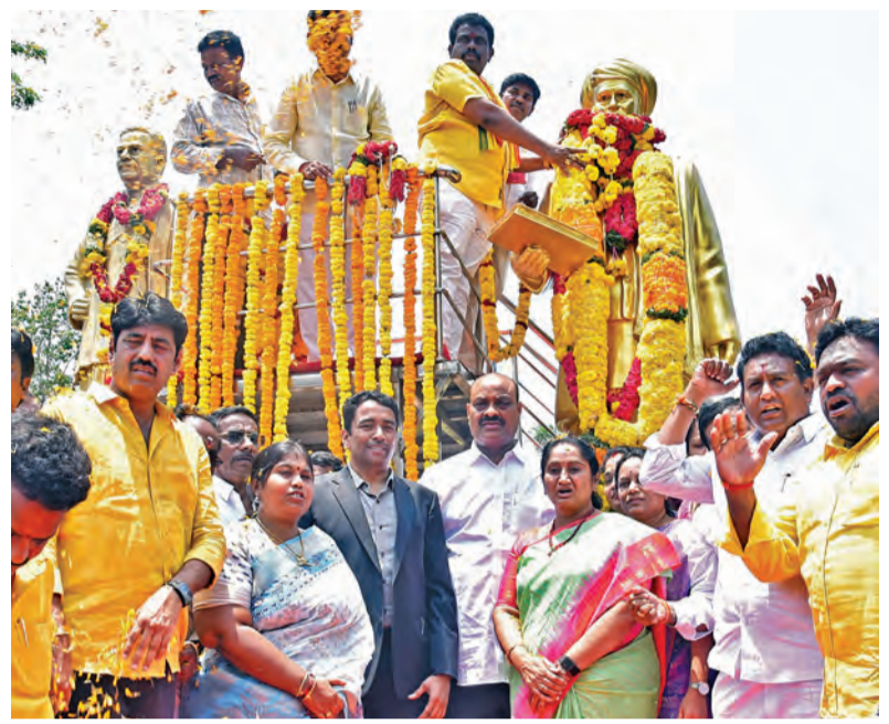
శనివారం మహాత్మా జ్యోతిబా పూలే జయంతినందంగా ఆయన విగ్రహానికి నివాళి అర్పిస్తున్న మంత్రులు