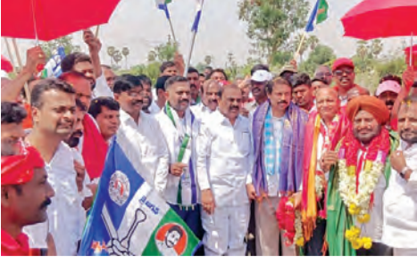
నూతన ఉపాధి హామీ చట్టాన్ని వ్యతిరేకిస్తూ పాదయాత్ర చేస్తున్న సిపిఎం నేతలు