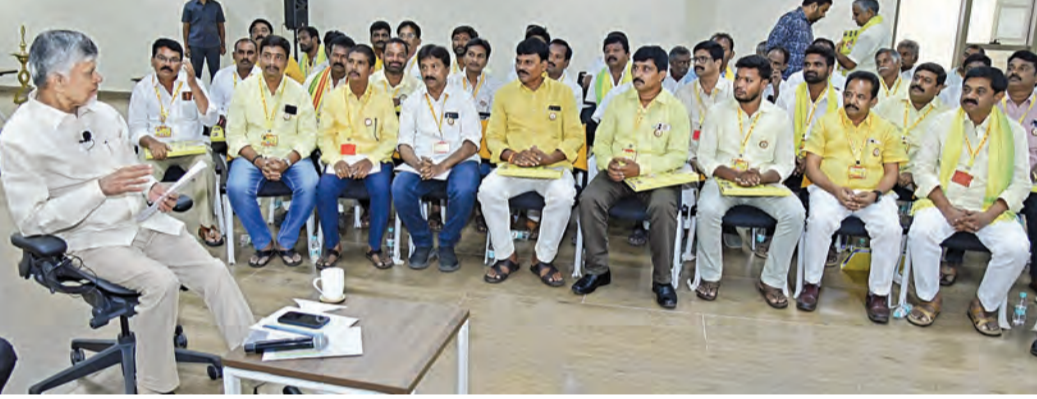
శనివారం డిడిపి కార్యకర్తల శిక్షణ కార్యక్రమంలో పాల్గొన్న సీఎం చంద్రబాబు నాయుడు

పాల్గొనేతలు, కార్యకర్తలకు సీఎం చంద్రబాబు సలహా పాల్గొ బలోపేతానికి 'ఇ-3' కార్యక్రమం ప్రభుత్వం కష్టాలు ప్రజలకు వివరించాలి శిక్షణ కార్యక్రమంలో పాల్గొన్న ముఖ్యమంత్రి